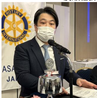
廣瀬社会奉仕委員長